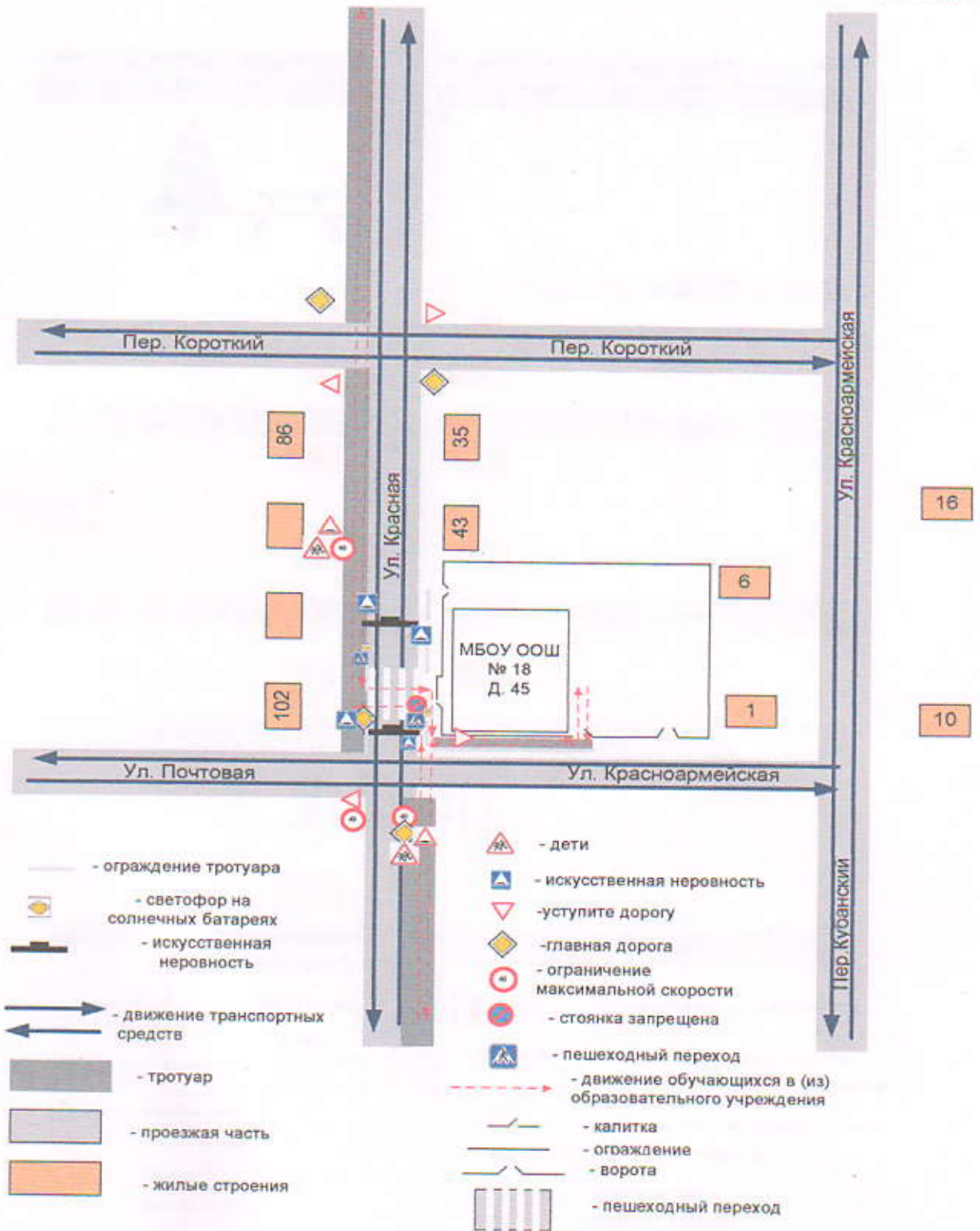
Схема организации дорожного движения в непосредственной близости от МБОУ ООШ № 18 им. Могилевского М.Г.